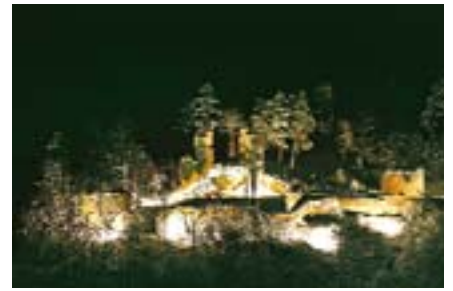
Sulz-Fischingen, Burgruine Wehrstein.

tens allernötigste Mauersanierungen, die von der Denkmalstiftung mit 19 360 Euro unterstützt werden sollen.