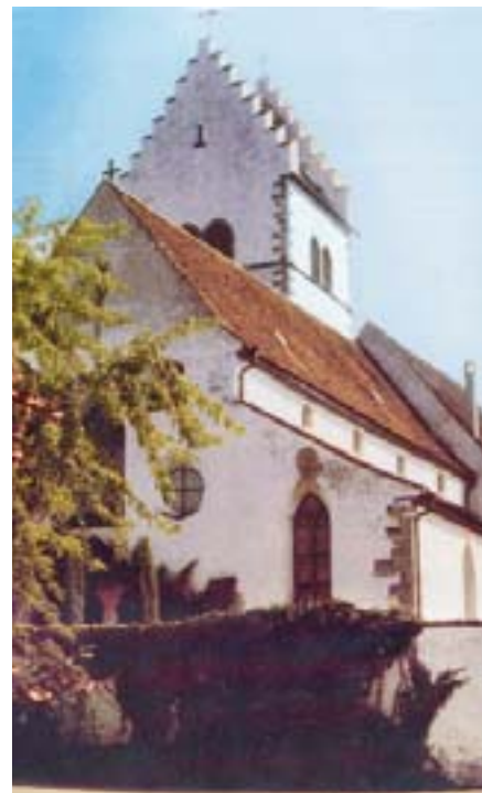
Bermatingen, St. Georg.

legte, im Mittelschiff thematisch mit Christus als Weltenrichter, im Chor Phasen aus dem Leben Jesu. Zu dieser intensiven gotischen Ausmalung kommen noch etliche barocke Ausstattungsstücke, namentlich Skulpturen und Altäre, so dass Bermatingen hier eine in dieser Vollkommenheit selten gesehene Koexistenz von Gotik und Barock bietet. Aber nicht genug damit: St. Georg hat auch noch in Langhaus und Chor sozusagen kongeniale Fenster mit historistischer Glasmalerei aus dem 19. Jahrhundert. Sie aber sind gefährdet, unter anderem wegen bauphysikalisch fehlerhafter, nicht „hinterlüft-