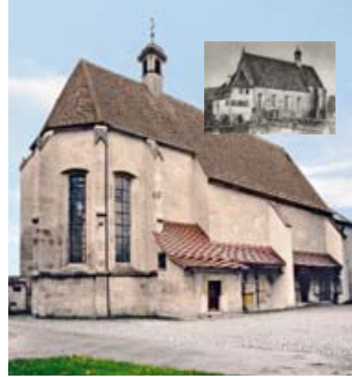
Schwäbisch Gmünd, Mesnerhaus St. Leonhard.

Kelter auf den Grundmauern derer von 1582 ist ein Bau von 1786. Um sie vor dem Abriss zu retten, wurde sie übrigens 1935 HJ-Heim. Später waren in der Kelter Notwohnungen untergebracht. 1968 kam es zu ersten Instandsetzungen an Dach und Toren.