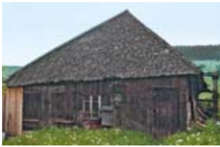
Breitnau, Siedelbachstraße 3, Hofmühle.