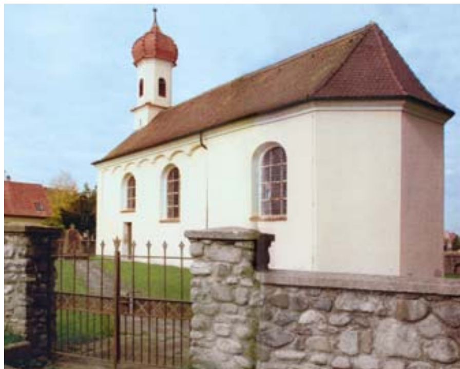
Ummendorf, Kapelle St. Johannes d. T.