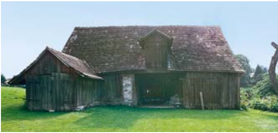
Kressbronn-Retterschen, Hofanlage Milz, Remise.

barer“ Außenfenster. Aber gerade diese Verglasungen gilt es nun zu retten und damit die kunsthistorische „Dreieinigkeit“ Gotik, Barock und Historismus. Die Denkmalstiftung beteiligt sich an den Maßnahmen mit 20 000 Euro.