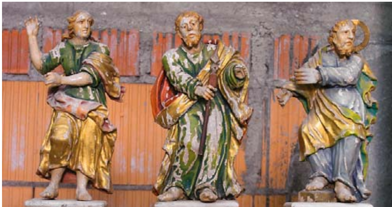
Westerheim, St. Stephanus.

Ortschaften und die spätere Wanderung der Kirche in den Ort wird zwar immer wieder postuliert, lässt sich aber ausgesprochen selten in dieser umfassenden und eindrücklichen Form im Bereich der Archäologie und der Bau- und Kunstdenkmalpflege deutlich ablesen.“