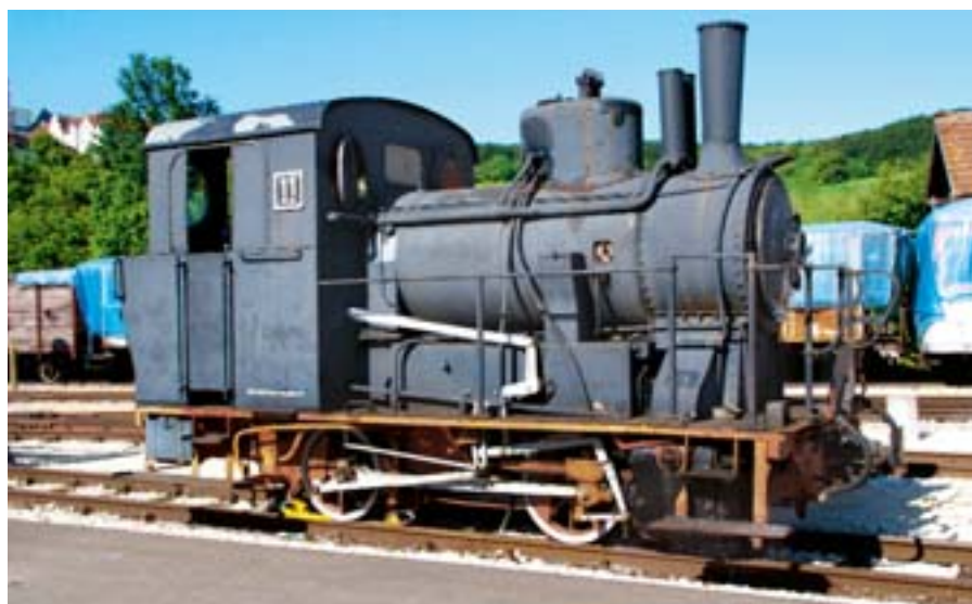
Neresheim, Dampflokomotive WN 11 der Härtsfeldbahn

Die Härtsfeld-Museumsbahn-Lok WN 11 ist ein vom Denkmalsockel herunter wiederbelebtes Dampflebewesen. Gebaut 1913 als Schmalspur-Zugmaschine für die 55,5 Kilometer lange Strecke zwischen dem ostwürttembergischen Aalen und dem bayerischen Dillingen mit der „Centralstation“ Neresheim unterhalb der weltbekannten Barockkirche. Die Spurweite dieser WN 11 betrug tausend Millimeter, die Höchstgeschwindigkeit 30 Stundenkilometer, die Gesamtlänge über Puffer 6,18 Meter und das Gewicht ohne Kohle und Wasser 14,5 und mit diesen Betriebsstoffen 20 Tonnen. Die WN 11, in der Maschinenfabrik Esslingen gefertigt, regelmäßig gewartet und fast mehr als jedes Gebäude verbessert, wurde 1964 außer Betrieb gestellt, als die Bundesbahn begann, sich in großem Stil von ihrer Vergangenheit zu trennen. Den Neresheimern allerdings war ihre „Schättere“, wie sie die Schmalspurmaschine wegen ihrer Geräusche liebevoll nennen, wert, die Lok aufzukaufen und sie im Ort als Denkmal für die Erschließungsgeschichte des Härtsfelds auf den Sockel zu heben – ein Sockel, aber kein Abstellgleis. 1994 holte man sie herunter und setzte sie auf die verbliebenen Schienen der Härtsfeldbahn. Mittlerweile reifen auch Pläne zur Reaktivierung der Museumsbahn ins bayerisch-schwäbische Dillingen