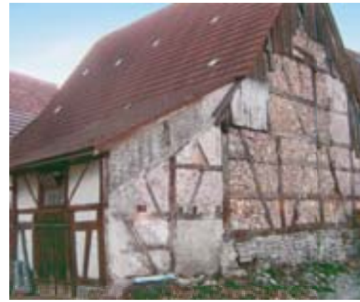
Ammerbuch-Altingen, Scheune Schwedenstraße 19.

Schloss Benzenhofen ist ein ganz und gar aus der Zeit gefallenes Vorkommnis und wohl einer der letzten „Schlossbauten“ im Land. Zinnen und Rundtürme laden zum architektonischen Ausflug in die Ritterzeit. Bauherr war der Freiherr Benz von Benzenhofen, der sich später noch als „Chateaur-