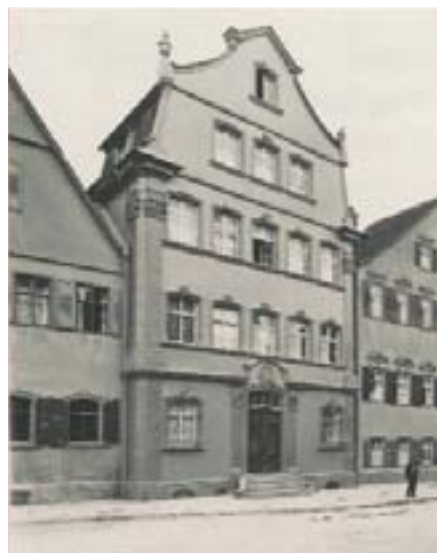
Schwäbisch Gmünd, Barockhaus Kornhausstraße 8.

aber weisen Putzflächen und die reichen Steinmetzelemente an der Fassade schwere Schäden auf. Für die Sanierung sind 137 402 Euro veranschlagt, an denen sich die Denkmalstiftung mit einem erheblichen Betrag beteiligt.