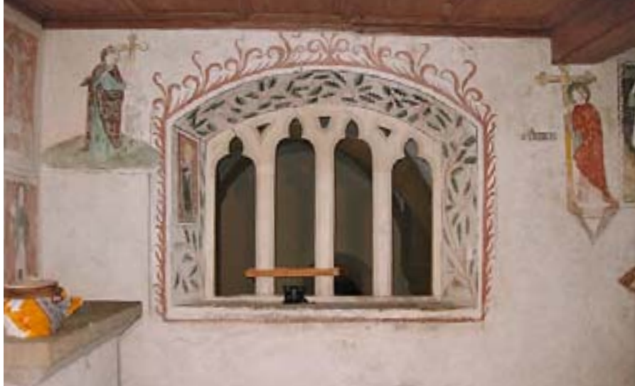
Kirchheim/Ries, ehemaliges Kloster.